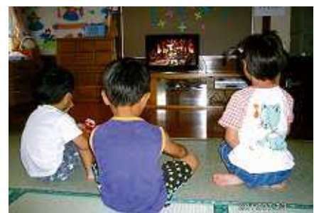
「きれいやなあ」と画面の美しさに感激しながら見えています。

私たちの施設は実親と暮らすことができない子ども達23名が入所している施設です。テレビ放送が地デジになるので大変困っていたところ支援をいただけることになり大喜びしています。多くの善意による募金なので、人々の善意に感謝してテレビを大切に使うと話しています。子ども達と大きくなってから社会に恩返しをしようと話をしています。ご寄付していただきありがとうございました。（大野市：児童養護施設 偕生慈童苑）